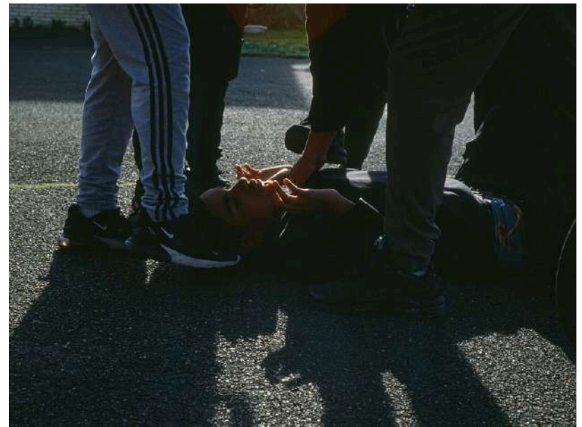
Photographies argentiques réalisées avec les élèves de seconde professionnelle du lycée Edouard Branly à Créteil