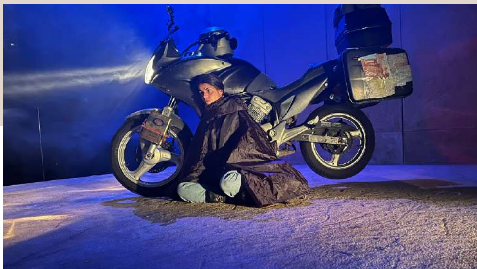
Photo de répétition

La comédienne fait donc revivre les aventures de la baroudeuse, dans une forme hybride entre le récit de voyage, le théâtre et le documentaire (vidéo d'interviews) afin de plonger le spectateur au plus profond de son expérience vécue.